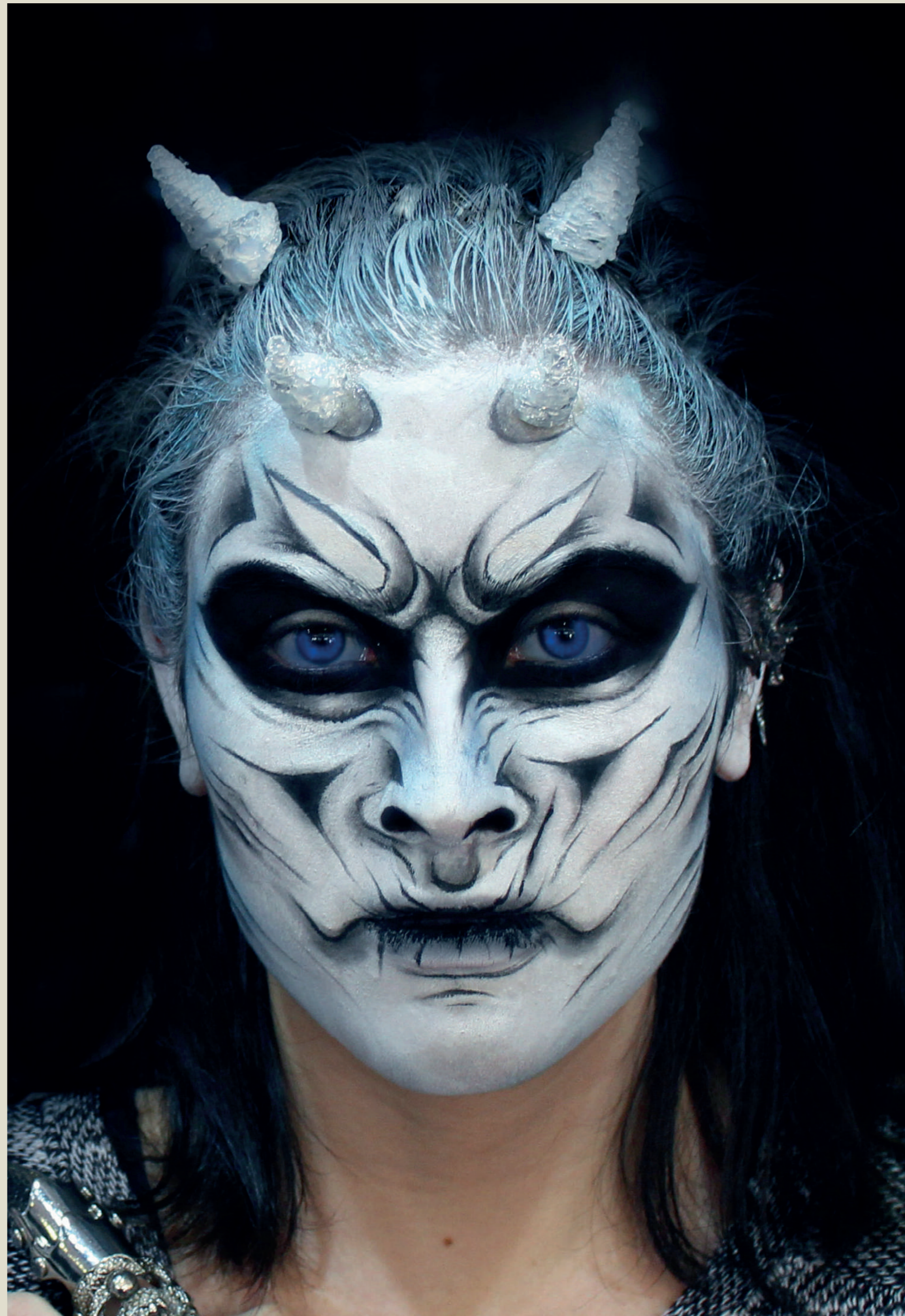
FACE & BODY PAINTING